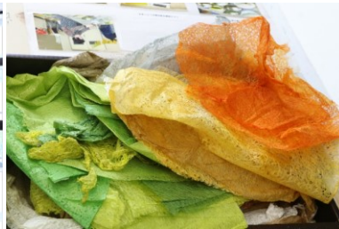
染料作りから手作りの色和紙の完成品

染料と色和紙作りが出来ず、作り置きした和紙を大切に使っているそうです。結構時間のかかるちぎり絵作りですが、仕事を忘れて取り組んでいる時間が充実していて楽しいと口々に語っていました。 Youtubeの動画では、作品の紹介と色和紙作りのお話し、そして教室でのちぎり絵作りの風景をご覧ください。 Youtubeへのアクセス方法は前ページをご覧ください。