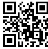
フラワーサークル心愛 Youtubeチャンネル