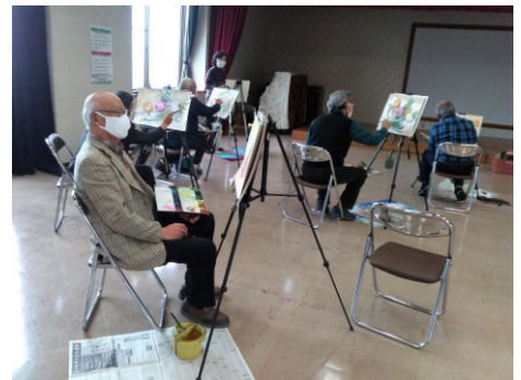
祢津公民館での例会の様子

令和3年3月2日～7日、東御市文化会館展示室において第12回彩明会会員展が開催されました。この会は絵画部会の中で水彩画を楽しんでいるグループです。月に1回、祢津公民館を教室にして作品を書き上げお互いに評価しながら活動しています。今回は、この作品展のよう