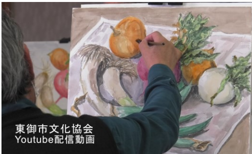
東御市文化協会 Youtube配信動画